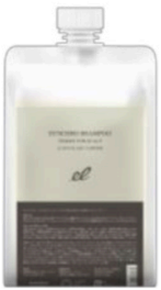
シンクロシャンプーファム FOR SCALP 業務用 容量1000ml 上代価格 税抜8,100円