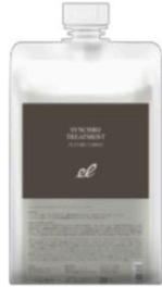
シンクロトリートメント 業務用 容量1000g 上代価格 税抜9,900円