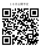
Web版カラーチャート

ノンジアミンカラーのクリアな発色を一度ご覧ください。 またHPにてWeb版ヘアカラーチャート・施術動画・レシピ情報なども掲載しております。