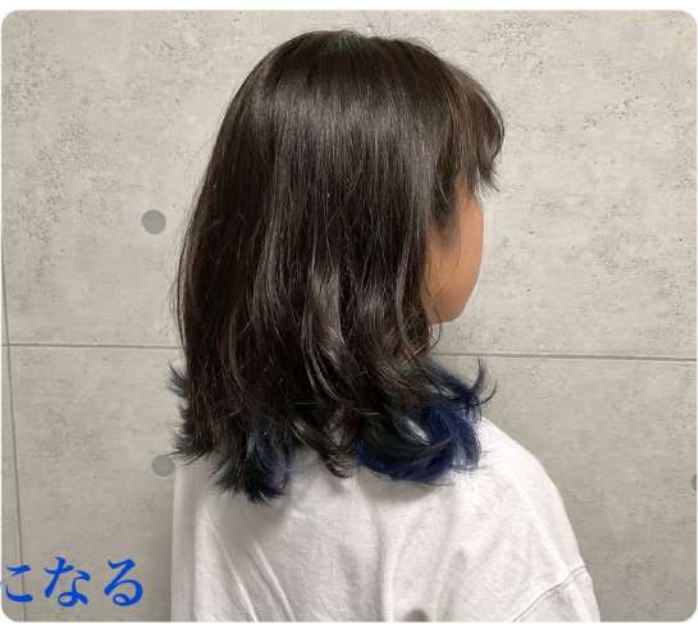
HP-N o 10→褪色中シルバーになる