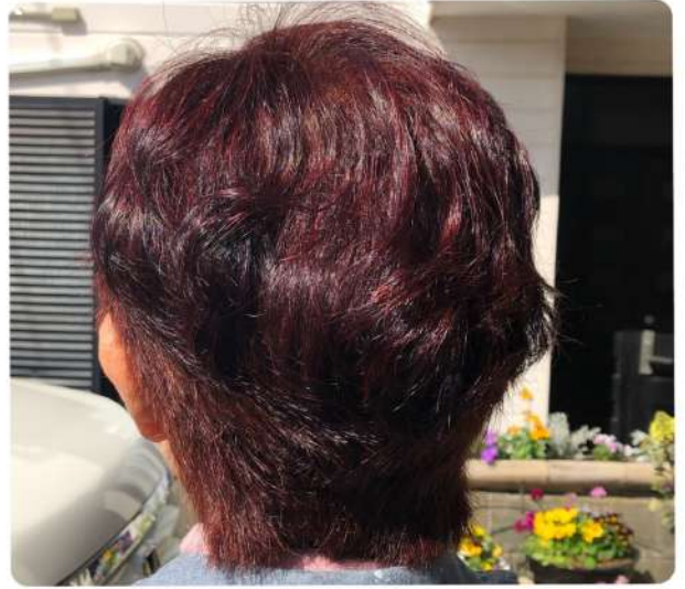
ビフォー無し 室内/室外 PB8+RP8(1:1)